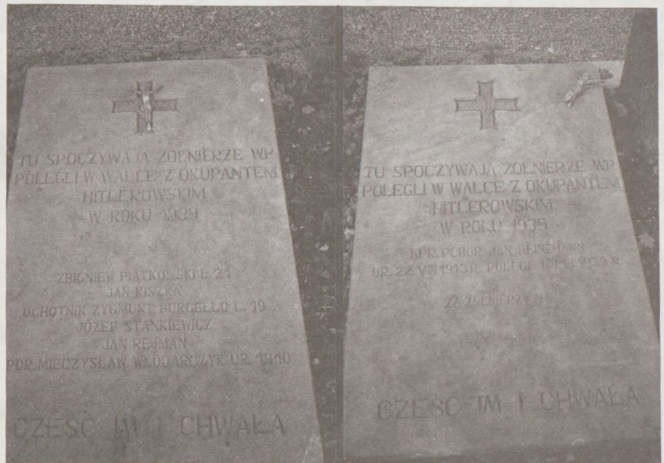
Cmentarz parafialny w Wilanowie. Płyty nagrobne żołnierzy, którzy polegli tutaj we wrześniu 1939 r.

Jednym w naszej gminie kryty basen pływacki, który znajduje się na terenie szkoły podstawowej nr 300 przy ul. Gubinowskiej, cieszy się dużym powodzeniem. Niezależnie od nauki pływania, w której uczestniczą setki uczniów z Wilanowa i okolic, wiele osób korzysta z pływalni jednorazowo lub posiadając karty wielorazowego wstępu, które można nabywać w sekretariacie szkoły. Jak nas poinformowała dyrekcja szkoły, są jeszcze możliwości kupienia kamietów na niektóre terminy w soboty i niedziele.