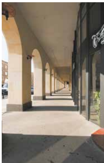
Podcienia biegnące wzdłuż ul. Królewskiej, poszerzające przestrzeń dla pieszych

Inwestorem budynku był Fundusz Kwaterunku Wojskowego – instytucja powołana w 1927 r. na mocy podpisanego przez Marszałka Józefa Piłsudskiego rozporządzenia wykonawczego do ustawy z 1925 r. „O zakwaterowaniu wojska w czasie pokoju”. Zadaniem funduszu było zdobywanie środków, zapewnienie terenów i budowanie nowych mieszkań dla żołnierzy zawodowych. Finansowanie inwestycji wzięły na siebie Bank Gospodarstwa Krajowego, a tereny pod budynki udostępniał Skarb Państwa, z zasobów przejętych po carskiej armii. Łącznie bank przeznaczył na ten cel 200 mln zł. Fundusz Kwaterunku Wojskowego wybudował od 1927 r. do 1934 r. w całej Polsce aż 522 budynki mieszkalne. Sprawna i efektywna działalność sprawiła, że rząd powierzył tej instytucji także wybudowanie kompleksu gmachów sądowych przy ul. Leszno (obecnie al. „Solidarności”) oraz olbrzymiego szpitala przy al. Niepodległości 218 (do wojny nie został ukończony, a po wojnie przeznaczono go na cele administracji rządowej).