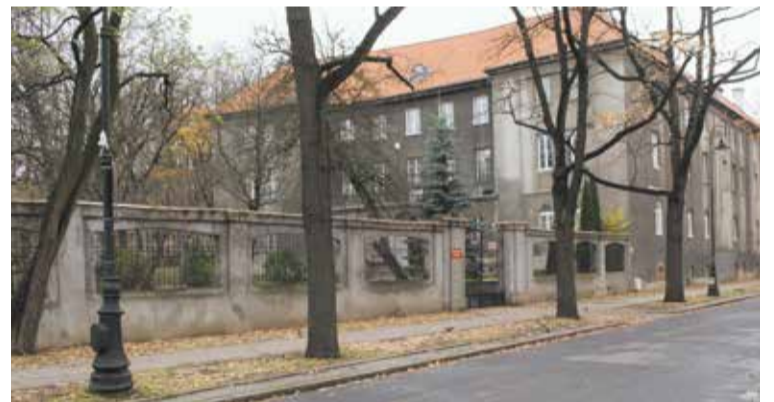
Budynki dawnej Miejskiej Szkoły Sztuk Zdobniczych i Malarstwa na rogu ul. Myśliwieckiej i Józefa Hoene-Wrońskiego. Obecnie mieści się tu Wydział Wzornictwa i Architektury Wnętrz warszawskiej Akademii Sztuk Pięknych