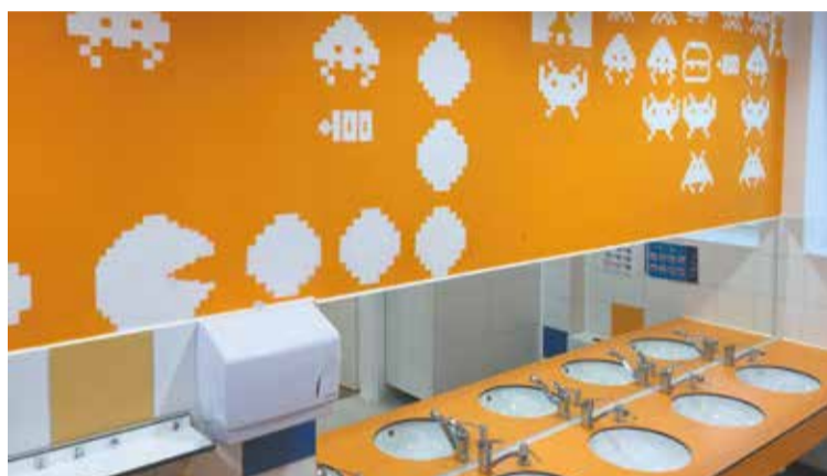
W śródmiejskim przedszkolu pojawił się popularny niegdyś „Pacman”

To wszystko spotkamy w bardzo przyjaznym dla dzieci Przedszkolu nr 72 przy al. „Solidarności” 72B. W bieżącym roku przeprowadzono tu remont sanitariatów. Zestawienie barw i pomysłów może zaskakiwać oglądających to miejsce po raz pierw-