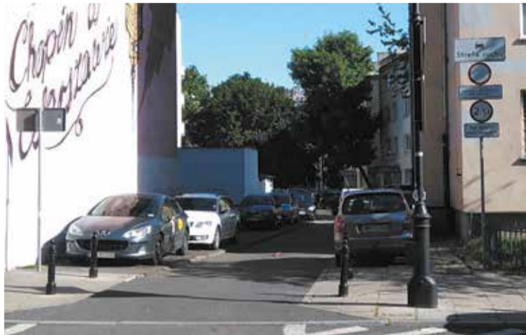
Uruchomiony cztery miesiące temu pilotażowy program ułatwiający parkowanie na śródmiejskich podwórkach okazał się dużym sukcesem

W ramach drugiego etapu realizacji programu nowe zasady parkowania zostaną wprowadzone na podwórkach o następujących adresach: • L. Waryńskiego 9 – Nowowiejska 10, 10A, 12/18 – J. i J. Śniadeckich 1/15, 17A, 19, 21 – pl. Konstytucji 3; • Nowy Świat 7; • Hoża 40 – Wspólna 37/39; • Mazowiecka 4; • Zagórna 2/4, 7/8 – A. Idzkowskiego 4; • Szwoleżerów 5, 7A – 29 Listopada 10A, 12, 14, 16, 18.