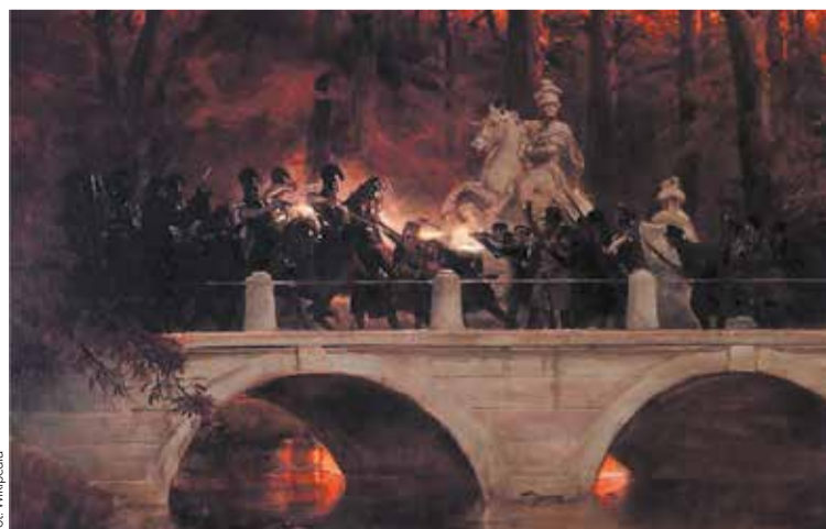
Starcie belwederczyków z kirasjerami rosyjskimi na moście w Łazienkach na obrazie Wojciecha Kossaka