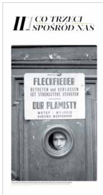
Eksponując „Co trzeci spośród nas” można oglądać na pl. Grzybowski do końca listopada br. Jest także dostępna online pod adresem: 1943.pl/wystawy/co-trzeci-sposrod-nas

dowej, Jad wa-Szem w Jerozolimie, a także Żydowskiego Instytutu Historycznego oraz Muzeum Getta Warszawskiego.