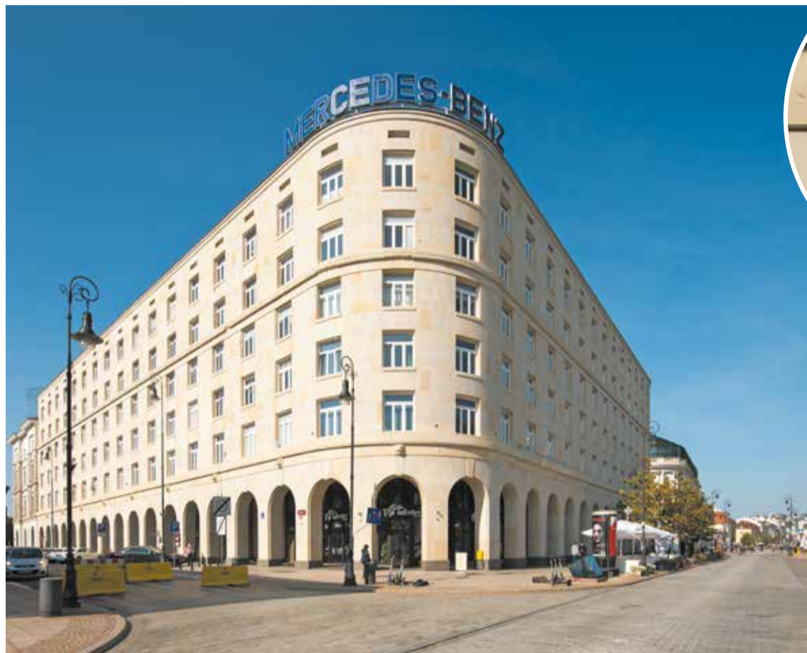
Dom Funduszu Kwaterunku Wojskowego przy Krakowskim Przedmieściu 11 tzw. Dom bez Kantów, widok od strony Uniwersytetu