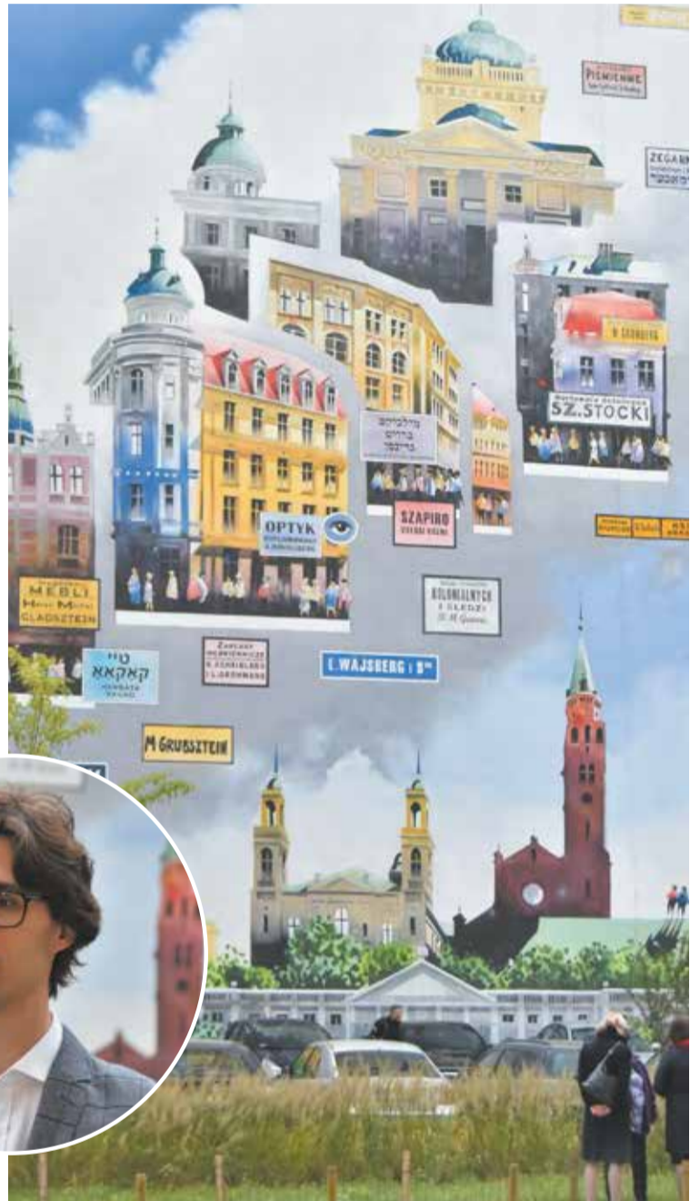
Ul. Prózna jest autentycznym zakątkiem dawnej Warszawy. Mural, zaprojektowany przez Tytusa Brzozowskiego, przypomina o tętniącej życiem przedwojennej Dzielnicy Północnej