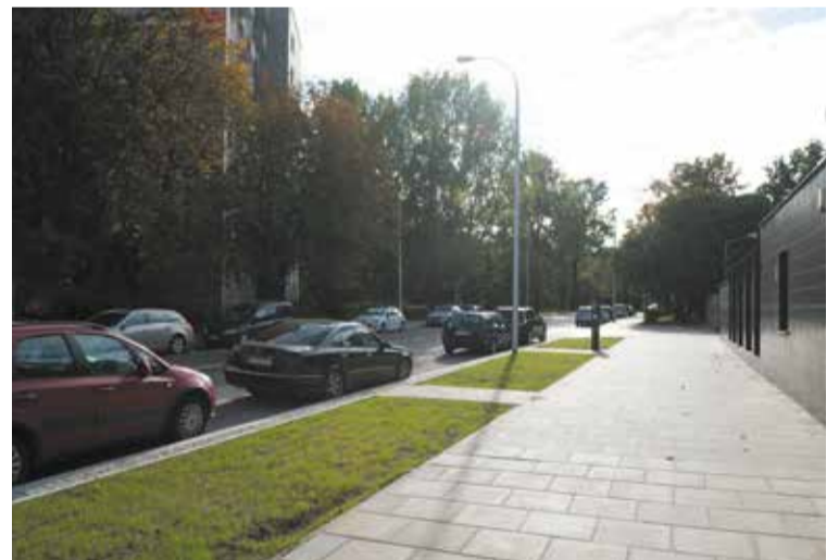
Stare i popękane chodniki zastąpiono eleganckimi płytami betonowymi

Wiosną przyszłego roku rejon ten pięknie się zazieleni. W niektórych miejscach zrezygnowano z nowych płyt chodnikowych i niebawem po-