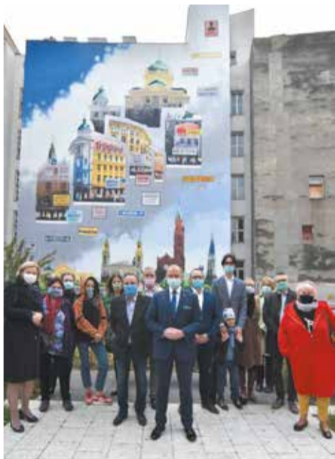
Uroczystego odsłonięcia muralu dokonał Aleksander Ferens, burmistrz Śródmieścia