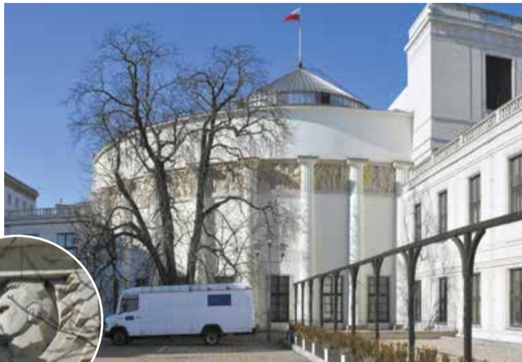
Wschodnia strona Sali Plenarnej Sejmu RP i fragment fryzu z podobizną Józefa Piłsudskiego

W okresie międzywojennym przy ul. Wiejskiej powstało wiele ciekawych,