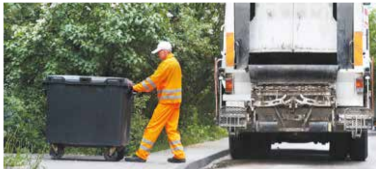
Wyższe opłaty za wywóz śmieci są efektem zmian w prawie wprowadzonych przez rząd

Podstawą miesięcznej opłaty będzie średnie zużycie wody z sześciu kolejnych miesięcy z ostatniego