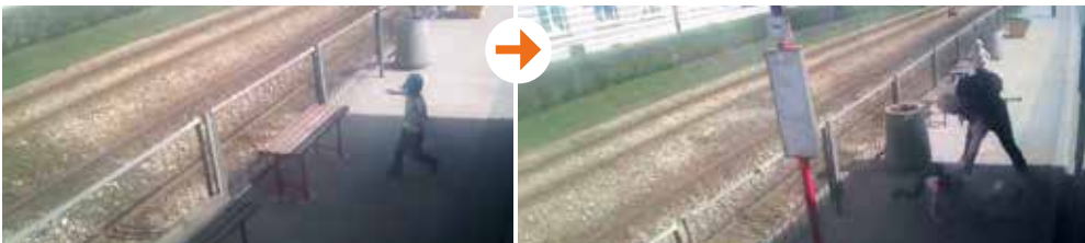
Przerażone dziecko pasażera zdążyło wyskoczyć. Nic mu się nie stało