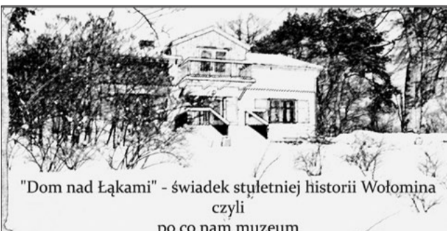
"Dom nad Łakami" – świadek stuletniej historii Wołomina czyli po co nam muzeum

- No właśnie – temat nadal jest aktualny. Nie wszyscy wiedzą, że NASK przygotowuje Ogólnopolską Sieć Edukacyjną, którą nieodpłatnie udostępni wszystkim szkołom. Jednakże, aby do OSE się dostać i skorzystać z jej zasobów musimy najpierw sami zadbać, mówiąc w przenośni, o dogodny i bezpieczny wjazd na tę autostradę z każdej naszej placówki. Zarząd powiatu wołomińskiego minionej kadencji utworzył w tym celu Centrum Usług Wspólnych, a zespół roboczy przygotował już dokumentację przetargową na wybudowanie nowoczesnej sieci edukacyjnej dla wszystkich naszych placówek oraz na świadczenie usług administrowania i bezawaryjnego utrzymania przez kolejne 3 lata. W budżecie zabezpieczono odpowiednie środki, więc nic nie stoi na przeszkodzie, aby ogłosić przygotowany przetarg.