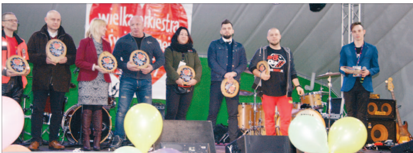
■ Organizatorzy i sponsorzy ząbkowskiego finału WOŚP.