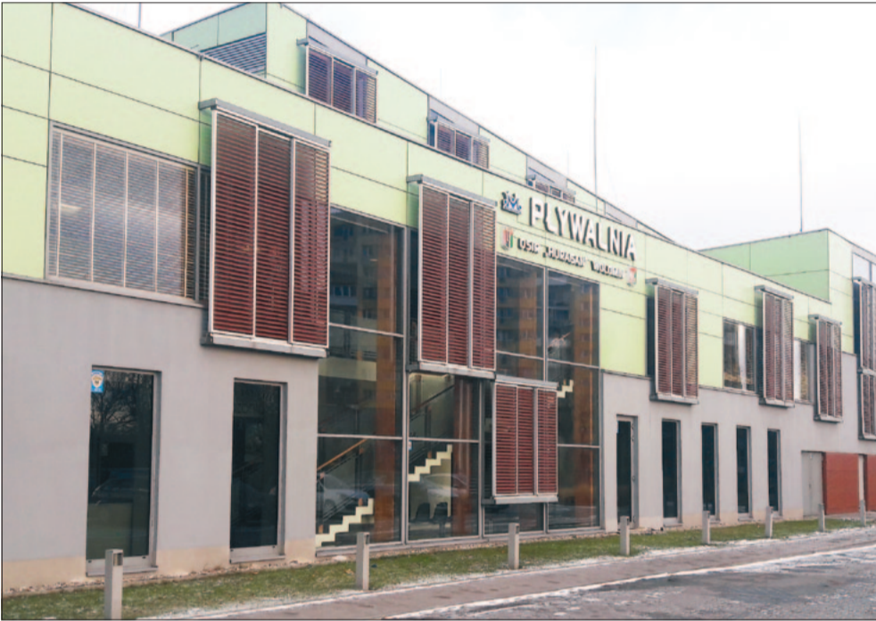
■ Akcja protestacyjna czy zbieg okoliczności?