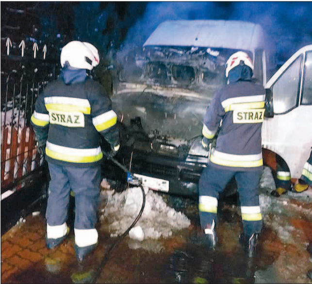
■Fot. OSP w Klembowie

W działaniach brały udział: OSP Klembów i JRG Wołomin filia Tuszcz.