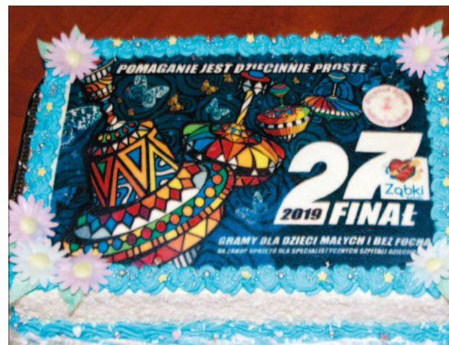
■ Tort WOŚP również stanął do licytacji.