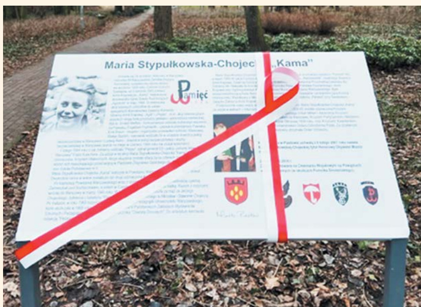
tablica odsłonięta 1 lutego w parku im. M. Stypułkowskiej-Chojeckiej przez Pana Sławomira Chojeckiego, syna bohaterki.