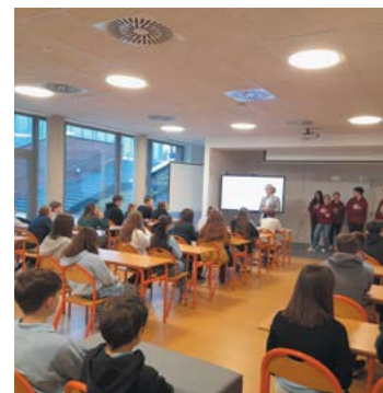
foto. LO im. Adama Mickiewicza w Piastowie

Jak mówił Roger Bacon: „Znajomość języków jest bramą do wiedzy”. LO z Oddziałami Dwujęzycznymi im. A. Mickiewicza w Piastowie kładzie szczególny nacisk na naukę języka angielskiego, jako języka wiodącego w placówce z oddziałami dwujęzycznymi oraz oddziałem międzynarodowym z programem IB DP, czego wyrazem jest opisana powyżej mnogość działań w realizacji nauczania języka angielskiego. O kolejnych działaniach przewidzianych na najbliższe miesiące będziemy państwa informować na bieżąco, a już teraz zapraszamy na stronę internetową liceum ( www.lopiastow.pl ) oraz na nasz profil na Facebooku ( www.facebook.com/LiceumMickiewicz/ ).