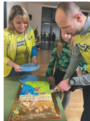
fol. Rozbiegany Piastów (archiwum prywatne)

przekazała nam w prezencie tort urodzinowy oraz restauracji Max Burgers w Pruszkowie za ciepły posiłek, który nam zapewniła.