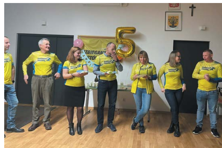
fol. Rozbiegany Piastów (archiwum prywatne)