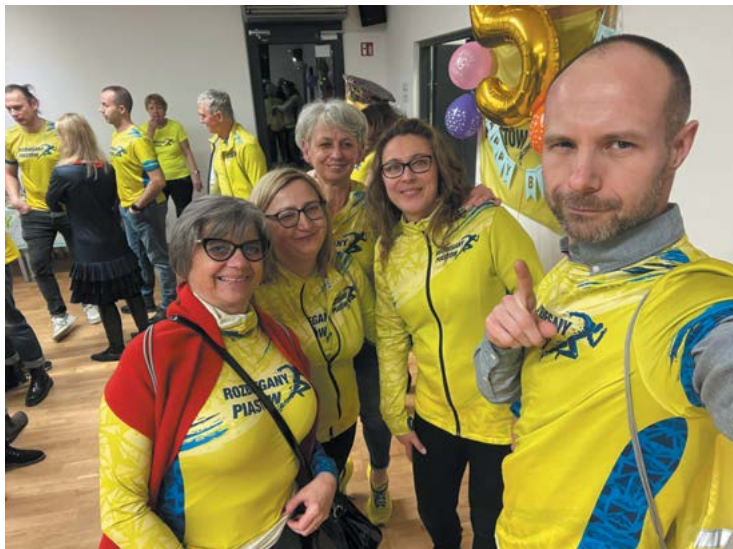
fol. Rozbiegany Piastów

Styczeń to wyjątkowy miesiąc dla Rozbieganych z Piastowa. Zazwyczaj nawet największy sceptycy „łamią” się by choć na chwilę się zatrzymać i dokładniej przyjrzeć, jak minęło ostatnie dwanaście miesięcy. Łatwiej z perspektywy minionego czasu ocenić, czy to co zaplanowaliśmy udało się zrealizować, czy może wręcz przeciwnie i w zasadzie już na samym początku wyznaczone cele gdzieś nam umknęły. Jestem zwolennikiem takich podsumowań.