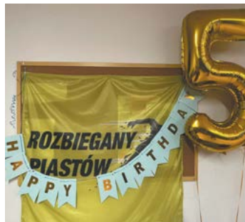
fol. Rozbiegany Piastów (archiwum prywatne)