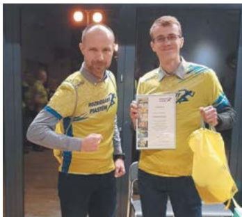
fol. Rozbiegany Piastów

Dziś z perspektywy czasu, uważam że zrobiliśmy wszystko