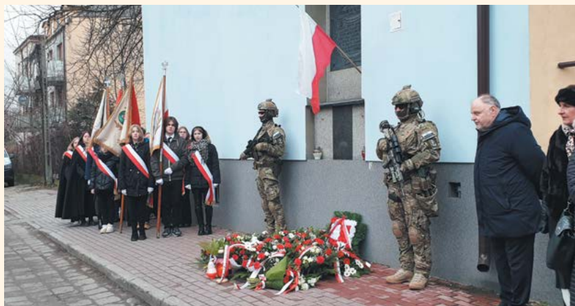
fol. Urząd Miejski w Piastowie