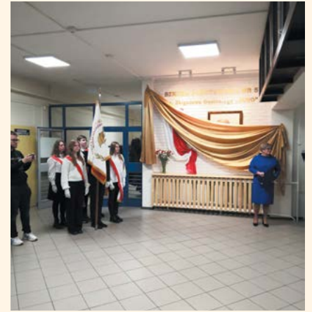
fol. Urząd Miejski w Piastowie