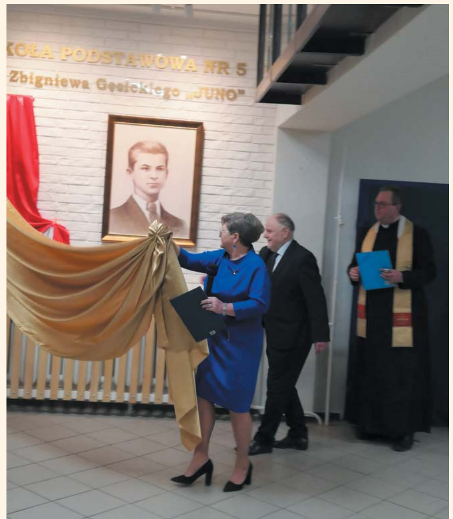
fol. Urząd Miejski w Piastowie