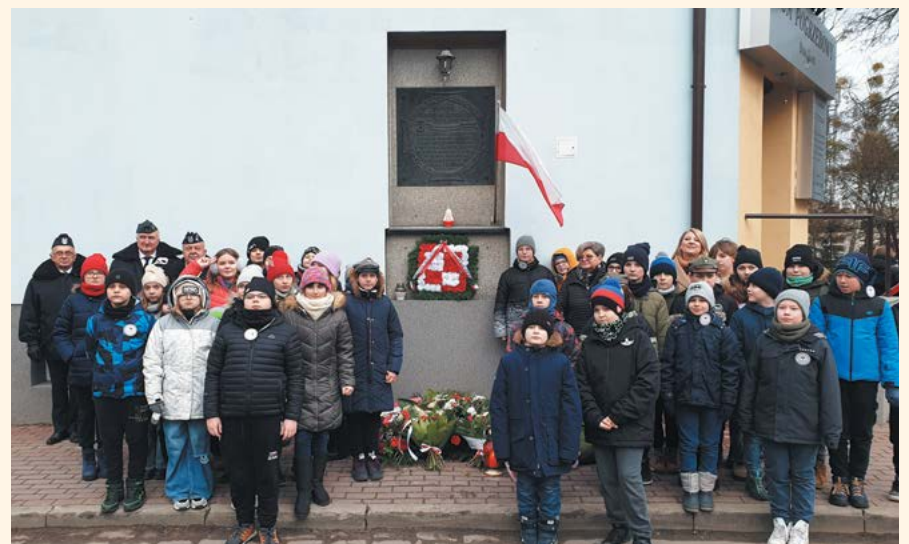
fol. Urząd Miejski w Piastowie