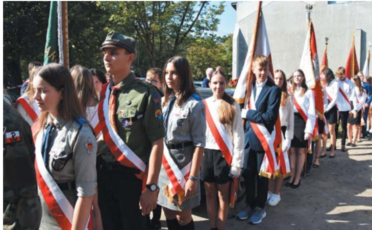
fol. Urząd Miejski w Piastowie